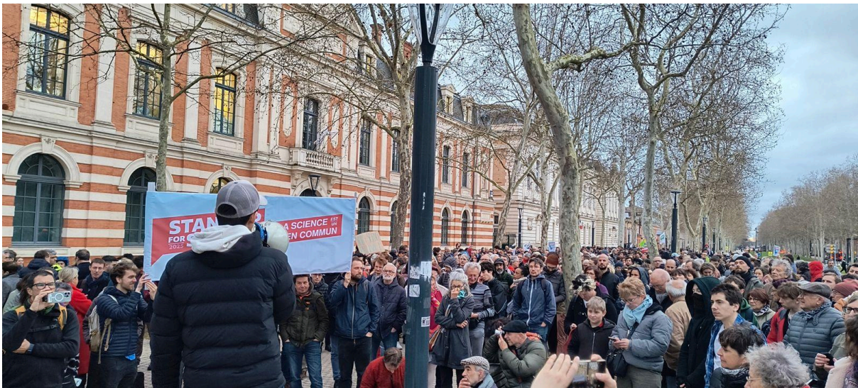
Marche et rassemblement, Toulouse