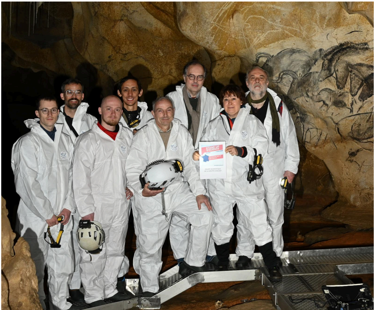
Grotte Chauvet-Pont d'Arc