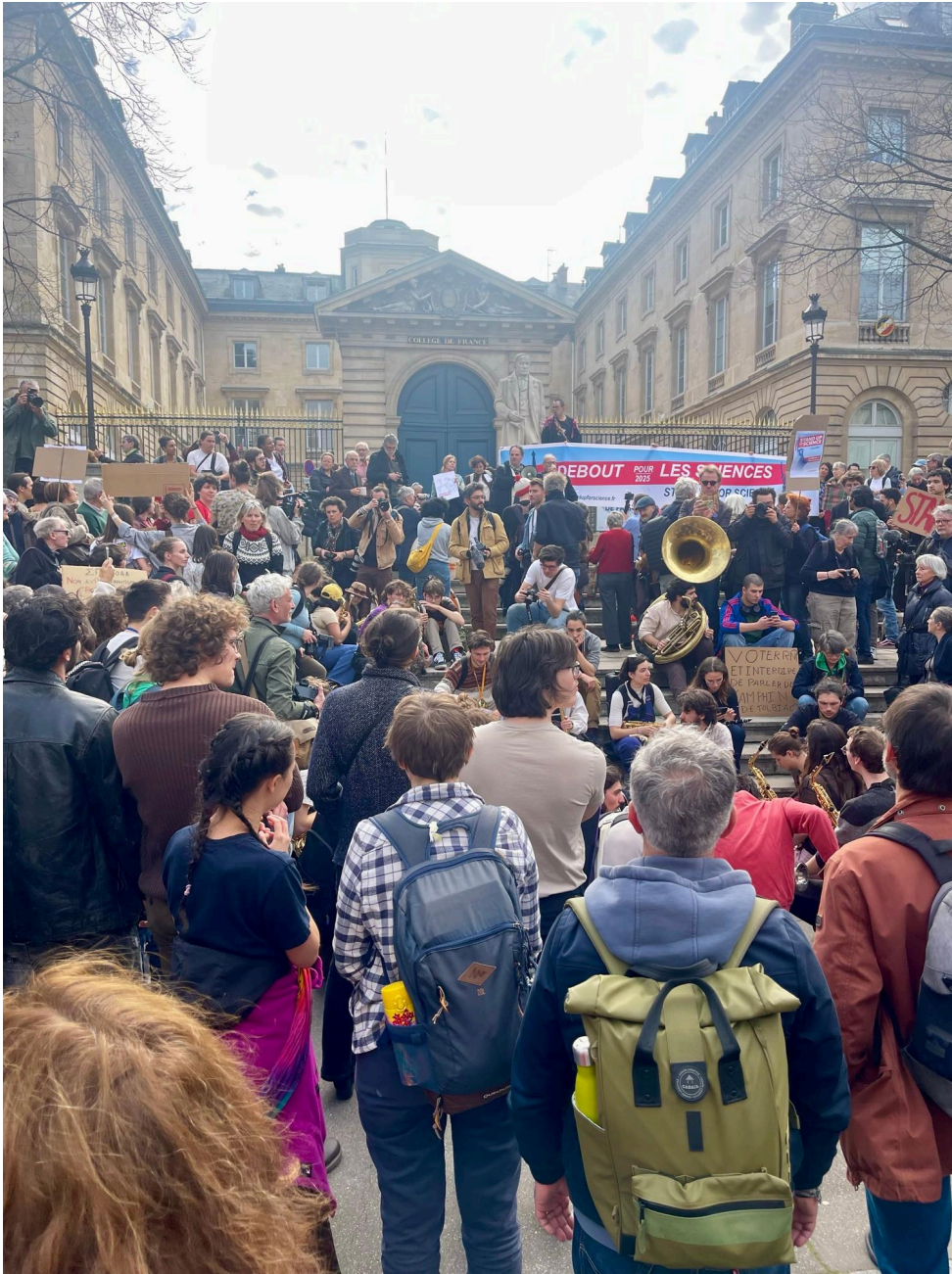
Collège de France, Paris