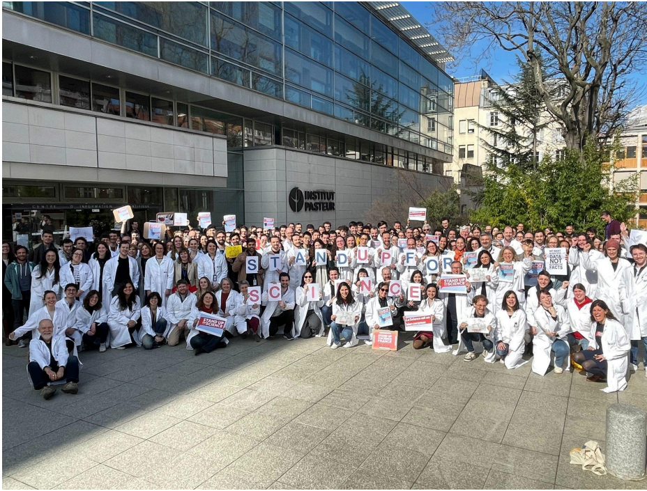
Institut Pasteur, Paris