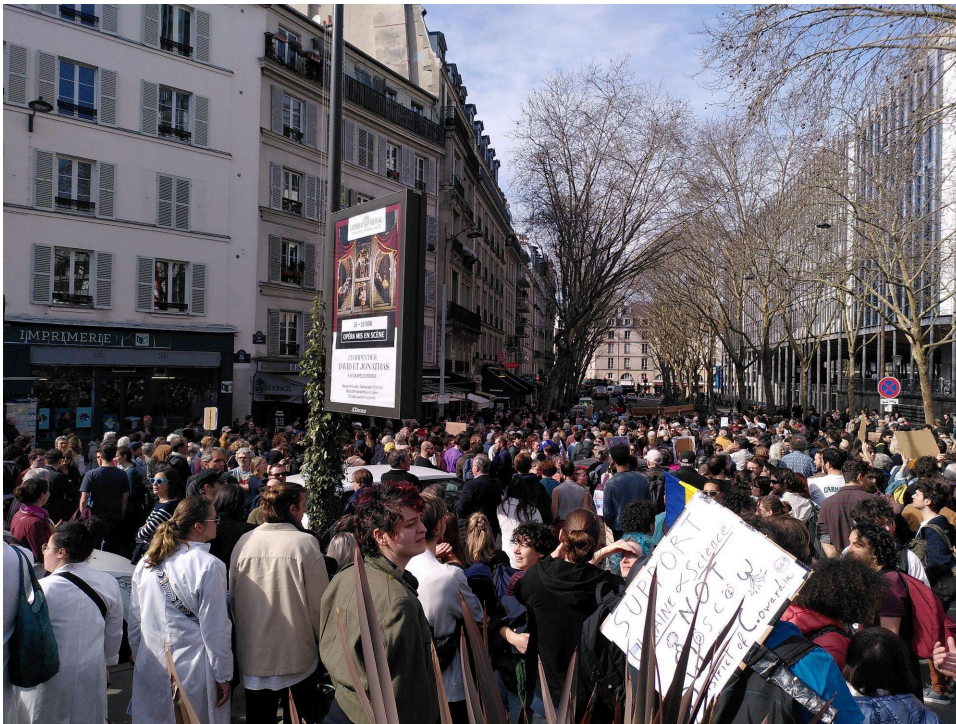
Départ de la marche parisienne à Jussieu